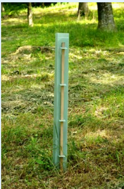
Hvis et af de nummererede træer fældes plantes et nyt.

er iøvrigt ingen forskel på, om man er medlem af folkekirken eller ej.