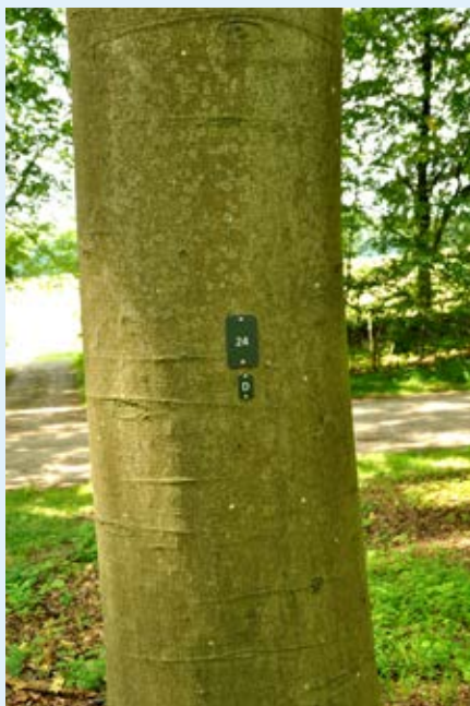
Træerne er nummereret, og ud for dette træ er nedsat en urne på en plads mærket D.