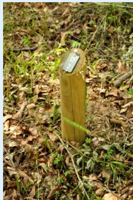
Med mellemrum er sat pæle opmålt af en landinspektør, så urnepladserne kan stedfæstes med stor nøjagtighed.

vejen. Lidt længere fremme kommer vi til en bevoksning af især ær som er lidt yngre end bøgene og med en tæt opvækst.