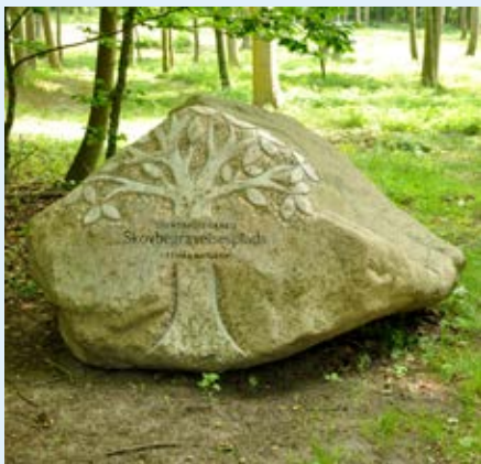
Denne sten står ved indgangen til skovbegravelsespladsen.

- Der må ikke plantes noget på gravstedet som ikke er en naturlig del af skoven, og der må ikke rejses gravsten. Vi tilbyder, at man kan lægge en lille mindeplade på A-5 størrelse fladt i skovbunden. Den bestilles på hjemmesiden og koster ca. 1500 kr.