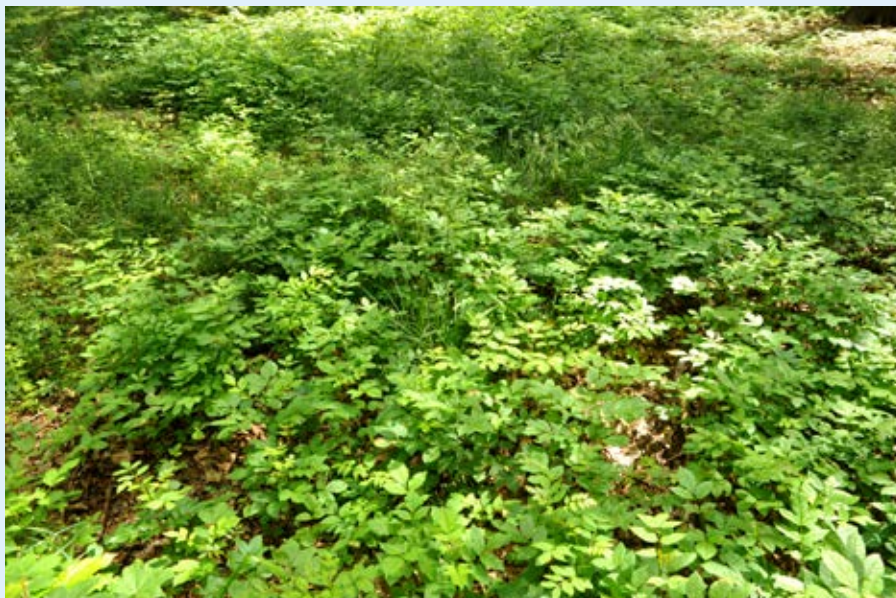
En del steder er der grupper af træopvækst – her ask – som må skæres ned for at give adgang til gravpladserne.

Gravpladsen grænser op til en skovvej, og vi går videre hen ad